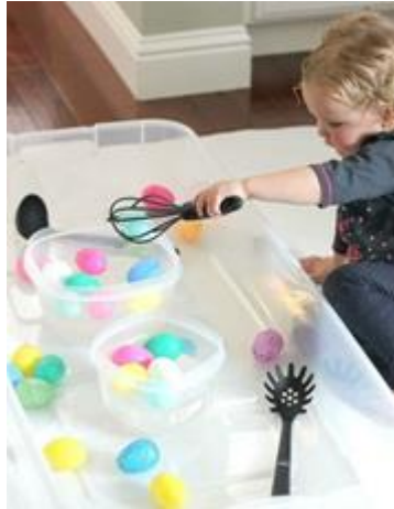
Foto: Activiteiten voor de Kinderopvang www.peuteractiviteitenweb.com